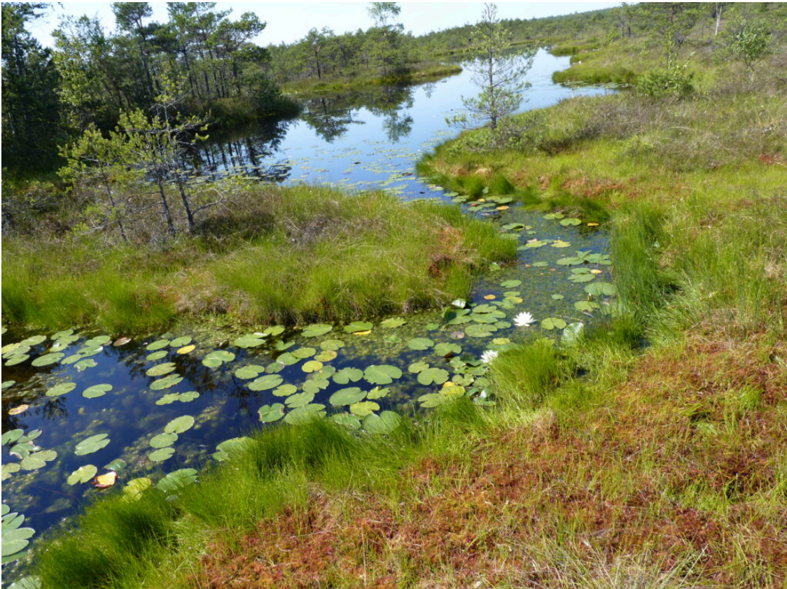
Typisches Biberbiotop in der Rominter Heide (im russischen Kaliningrad) – so hat es einst auch im Umfeld des Alpenrheins ausgesehen.

Der Konflikt eskalierte im Jahre 2015 in Liechtenstein, wo gegen zwei Dutzend Tiere getötet wurden. Dies geschah auch in den liechtensteinischen Naturschutzgebieten Schwabbrünnen-Äscher, Heilos und Äulehäg. Die Begründung liegt bei der zu gewährenden Sicherheit, nach meiner Meinung auch dort, wo die Biber kaum Schaden anrichten, aber durch spätere Abwanderung vielleicht einmal anderswo anrichten könnten, so gesehen am Balzner Schlossbach.