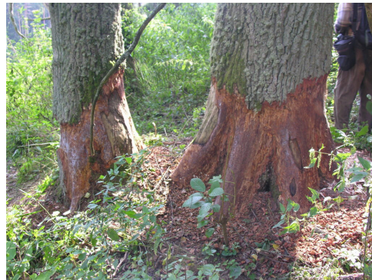
Die Biber scheinen manchmal „übermütig“ zu sein und gehen auch an dicke Bäume die sie nicht fällen können.

Der einberufene „Runde Tisch“ führte zu emotionalen Debatten und erbrachte wenig Verständnis für das amtliche Vorgehen ohne vorgängige Kommunikation. Ein schon lange gefordertes Biberkonzept für Liechtenstein wurde im Januar 2018 vorgestellt. Man spricht dort beschönigend von einer ultima ratio mit „Entnahme“ der Tiere. So wurden Biberfallen im Hälos, im Äulehäg und im Schlossbach in Balzers aufgestellt. Das wurde von der Liechtensteinischen Gesellschaft für Umweltschutz (LGU) und der Botanisch-Zoologischen Gesellschaft Liechtenstein-Sarganserland-Werdenberg (BZG) ins mediale Licht gebracht. In einer Medienmitteilung vom 27. März 2017 protestierten auch die benachbarten Umweltorganisationen WWF St.Gallen, und Pro Natura St.Gallen gegen den Umgang mit freilebenden Bibern mit dieser Tötungspraxis, weil dies auch im Schweizer Teil des Flusssystemes massiv stört. In der Schweiz wurde nach ihren Aussagen noch kein einziger Biber getötet. Diese Pressemitteilung fand eine mediale Beachtung, so in den Tageszeitungen und im Fernsehen DRS. Ebenso erschienen in den Liechtensteiner Zeitungen zahlreiche Leserbriefe zum Biber, mehrheitlich zu Gunsten des Bibers.