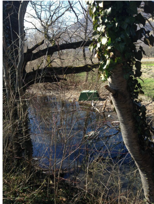
Biberfalle im Naturschutzgebiet Äulehäg (Foto: Anni Schön).

Mit dem Stichwort „Sicherheit“ kann man jegliche Güterabwägung und Debatte unterbinden. Sicherheit ist die oberste Maxime unserer Gesellschaft. Wir sind eine „Vollkaskogesellschaft“, wo jegliches Risiko verpönt ist. Risiko- und Kosten-Nutzen-Abwägungen wären aber bei der Schadenabwehr durchaus Teil von Entscheidungsprozessen sein. Hier wären auch Überlegungen zur Natur einzubeziehen und ihr auch ein Wert beizuordnen. Nach meiner Meinung wird in konkreten Fällen wie im Triesner Hälos die Sicherheit zu stark vorangetrieben (vgl. meine Webbeiträge über illegale staatliche Bibertötung 2017 und Sicherheit 2019 ). Man muss hier von einem „Grenznutzen“ für die Sicherheit sprechen. Wir können unter dem Vorwand der Sicherheit nicht die ganze rheintalische Biberpopulation „entnehmen“, um beim verharmlosenden Begriff zu bleiben.