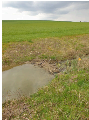
Biberdämme können durch Rückstau Landwirtschaftsflächen überschwemmen.