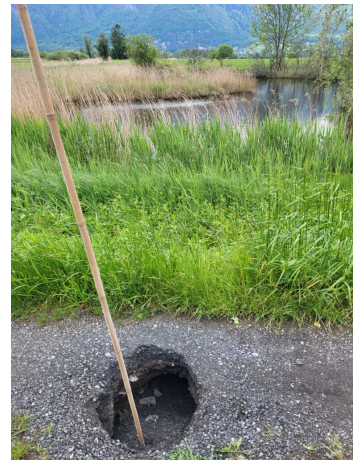
Biber legen ihre Höhlen auch unter Flurwegen an, die dadurch beschädigt werden können.

Dieses unsägliche Vorgehen führte im März 2017 zu einer heftigen Biberdebatte in Liechtenstein und in der benachbarten Region. Für den geschützten Biber wurden Ausnahmeregelungen beansprucht. Im Naturschutzgesetz in Art. 28 a werden die Ausnahmen benannt, wobei verwaltungsrechtliche Grundsätze zu