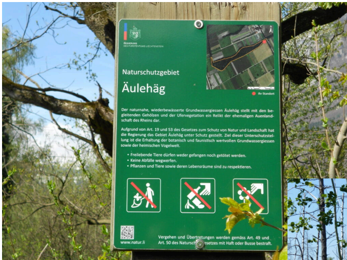
Naturschutztafel Äulehäg: Freilebende Tiere dürfen weder gefangen noch getötet werden.

Grundwasser gespeichert und die Ufervegetation gefördert wird. Der Biber bietet grosse Chancen für die Artenvielfalt, die Ökosystemfunktionen, den Wasserhaushalt und die Landschaftsstrukturen. Sein Wirken schafft für weitere Arten Lebensräume. Der Biber wird so zum „Ökosystemingenieur“ als Baumeister in der Natur. Er schafft offene Flächen, wo vorher der Wald die Flächen bedeckte. Das führt zu „Klein-Amazonien“ als Landschaftsaspekt.