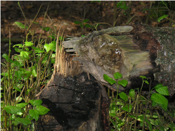
Typische Nagespuren als Folge seines Wirkens.

Ein Tier, das fast einen Meter lang und 30 Kilogramm schwer wird, ist in der Natur nicht zu übersehen. Auch sein Wirken müsste auffallen. Umso weniger nachvollziehbar ist es, dass der Zeitpunkt seiner Ausrottung im Alpenrheintal unbekannt ist. Wir wissen nur, dass er einst am Alpenrhein vorgekommen ist. Dafür müssen wir aber weit im Kalender zurückgehen. Wir finden in den Abfällen an den prähistorischen Siedlungsplätzen des Eschner Lutzengüetle (Hartmann-Frick 1959) wie auch auf dem Borscht auf dem Schellenberg und hier bis in die frühe Bronzezeit Hinweise seines Vorkommens (Hartmann-Frick 1965). Auch im spätrömischen Kastell in Schaan fanden sich in Abfällen Biberknochen (Würgler 1958). Auf der Burg Lichtenstein bei Felsberg-Chur, sollen bei Grabungen auch Biberknochen gefunden worden sein, was in die Zeit um 1000 datiert wurde (persönliche Mitteilung