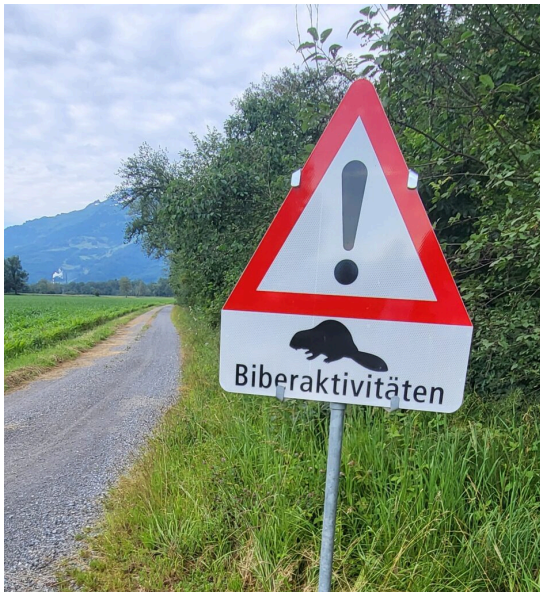
Achtung: mögliche Biberschäden an Fahrweg im Bannriet südlich von Bendern.

berücksichtigen sind. Das hinderte die Behörden nicht daran, im April 2015 eine dreiköpfige Biberfamilie in einem Schlammsammler im Naturschutzgebiet „Schwabbrünnen-Äscher“ in Eschen und zwei Tiere im Triesner Naturschutzgebiet „Hälos“ als Erste zu töten. Man dürfte meinen, dass ausgerechnet die dort heimische Tier- und Pflanzenwelt in Naturschutzgebieten auf diesem einem Prozent der Landesfläche – wie der Name besagt – Vorrang hat. Weitere Tiere wurden in den Jahren 2016 und 2017 getötet. Die letzten Tiere sollen im Winter 2022 und 2024 getötet worden sein.