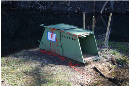
Biberfalle am Schlossbach in Balzers.

Im bisherigen Vorgehen spiegelt sich ein unterschiedliches Mensch-Natur-Verhältnis, eines eher biophil mit Liebe zur Natur und das andere eher biophob mit Angst vor der Natur. Bei anthropozentrischer Sichtweise wird der Kontrollverlust dargestellt und Liechtenstein sei viel zu klein, während eine biozentrische Sichtweise die Natur als gleichberechtigt sieht und damit auch Kosten für bauliche Massnahmen akzeptiert. Selbstverständlich will trotzdem niemand Naturfeind sein.