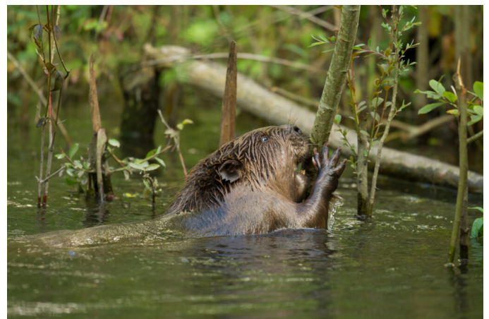
Biber – der Vegetarier (Foto: Daniel Erni).

Der Biber bringt so Dynamik in die Landschaft. Er besitzt ein dichtes Fell mit bis 230 Haaren pro Quadratmillimeter, was ihn vor Nässe und Kälte schützt. Er besitzt einen platten, haarlosen kellenförmigen Schwanz zum Steuern. Er ist dämmerungs- und nachtaktiv und macht keinen Winterschlaf. Monogam lebt er im Familienverband mit seinen Jungen und häufig auch noch mit der letztjährigen Generation. Er wird zehn bis zwölf Jahre alt, steht in Liechtenstein unter Naturschutz und ist auch auf europäischer Ebene durch die Berner Konvention geschützt (Fasel 2014a).