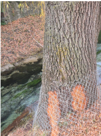
Der Biber geht auch an dicke Stämme, und will man diese behalten, so braucht es einen Baumschutz.

Der Konflikt eskalierte im Jahre 2015 in Liechtenstein, wo gegen zwei Dutzend Tiere getötet wurden. Dies geschah auch in den liechtensteinischen Naturschutzgebieten Schwabbrünnen-Äscher, Heilos und Äulehäg. Die Begründung liegt bei der zu gewährenden Sicherheit, nach meiner Meinung auch dort, wo die Biber kaum Schaden anrichten, aber durch spätere Abwanderung vielleicht einmal anderswo anrichten könnten, so gesehen am Balzner Schlossbach.