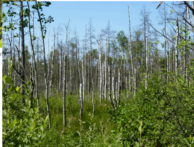
Der Biber staut mit dem Dammbau und kann sein Hinterland in eine Seenlandschaft verwandeln, wodurch die Waldbestockung abstirbt.

Grundwasser gespeichert und die Ufervegetation gefördert wird. Der Biber bietet grosse Chancen für die Artenvielfalt, die Ökosystemfunktionen, den Wasserhaushalt und die Landschaftsstrukturen. Sein Wirken schafft für weitere Arten Lebensräume. Der Biber wird so zum „Ökosystemingenieur“ als Baumeister in der Natur. Er schafft offene Flächen, wo vorher der Wald die Flächen bedeckte. Das führt zu „Klein-Amazonien“ als Landschaftsaspekt.