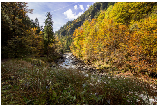
Im Samina-Galinatal – hier in Herbstaspekt im Saminatal – soll grenzüberschreitend in Liechtenstein und Vorarlberg ein Wildnisgebiet ausgewiesen werden (Foto: Josef Heeb).

Die Akzeptanzprobleme für den Erhalt oder Schaffung von Wildnis sind offensichtlich. „Natur Natur sein lassen“ ist als Naturschutzziel noch nicht in breiten Gesellschaftsschichten tragfähig gestaltet. Es braucht noch einiges an Kommunikation, um das Anliegen zu vermitteln. Viele Skeptiker sehen bei der Zielwildnis (Rewilding) die Schaffung einer „Pseudowildnis“, welche gar die vorhandene Artenvielfalt gefährde. Das kann im Einzelfall auf konkreten Parzellen zutreffen, in einer grösserräumigen Gesamtschau ist das Gegenteil der Fall. Die Biodiversität nimmt zu. Viele Förster meinen, erst ihre Arbeit habe den Wald zu einem wertvollen Lebensraum gemacht. Eine Aufgabe der Nutzung berge unkalkulierbare Risiken, so in deutschen Fachblättern zu lesen.