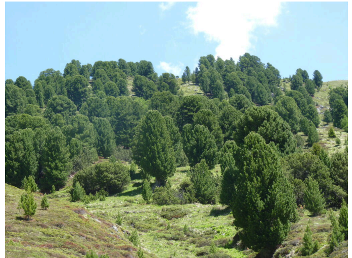
Der 86 ha grosse und mit 2100-2300 Meter über Meer höchst liegende Arvenwald Tamangur im Unterengadin ist ein Naturwaldreservat ohne weitere forstliche Nutzung. Das Ziel ist es, 10 Prozent der Schweizer Wälder als Waldreservate auszuweisen.

Zusammenfassend lässt sich also sagen, dass ungenutzte Areale oft als Abwesenheit von Kultur und Arbeit statt als Präsenz einer eigenen, wertvollen Form von Natur interpretiert werden. Darum kann der Begriff der Wildnis (wilderness) anecken. Wir erleben Aspekte dieses Wandels bereits in unseren privaten Gärten mit dem englischen Zierrasen und exotischen Gehölzen versus die aufkommende Naturgartenidee. Der nicht aufgeräumte Wald wurde ebenso lange als Unordnung empfunden und erst allmählich wird die Bedeutung von Alt- und Totholz anerkannt. Mit alten Wäldern lernen wir, wie ein mitteleuropäischer Urwald überhaupt funktioniert, wie er auf den Klimawandel reagiert und mit Naturkatastrophen fertig wird. Das wird er ja, sonst hätten wir keine Wälder – siehe auch die Entwicklungen im Nationalpark Bayerischer Wald nach Borkenkäferbefall.