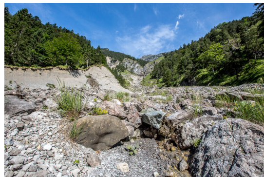
Rüfedynamik im Saminatal.

Die umweltsychologische Forschung liefert uns Hinweise, wie solche Akzeptanzprobleme zustande kommen. Als Erstes muss man sich ein Wildnisgebiet vorstellen können, also wie das in Zukunft aussehen wird. Das fällt uns Menschen schwer. Viele Betroffene befürchten, für einen eher diffusen und schwer abschätzbaren gesellschaftlichen Nutzen persönliche Nachteile oder unerwünschte Entwicklungen vor der eigenen Haustüre in Kauf nehmen zu müssen. Aus Angst vor Unbekanntem und einem Kontrollverlust will man lieber alles so lassen, wie es ist.