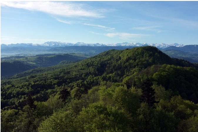
Der Wildnispark Sihlwald bei Zürich bietet Anschauungsunterricht für die freie Dynamik in der Waldentwicklung.

Was ist Wildnis? Sie bezeichnet grossflächige, vom Menschen weitgehend unbeeinflusste Landschaften, in denen natürliche Prozesse ablaufen können. Diese Räume sind weitgehend unerschlossen, frei von Siedlungen und Infrastrukturen und damit wie erwähnt Rückzugsräume für die biologische Vielfalt. Hier kann sich ein Konflikt zwischen dem Wunsch nach Ordnung und dem Wert von natürlichen Prozessen aufbauen.