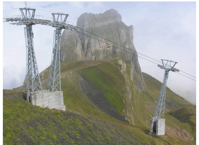
Gegen 2'500 Bergbahnen erschliessen die Schweizer Alpen.

Die Greina wurde 1996 ins Bundesinventar der Landschaften und Naturdenkmäler von nationaler Bedeutung aufgenommen und geschützt. Die grosse Symbolkraft für den Erhalt der unerschlossenen Hochebene Greina bleibt als „Kraftort“ und Schweizer „Naturheiligtum“ aufrecht. Wir brauchen allerdings noch mehr „Greinas“, so wie wir auch mehr als einen Nationalpark in der Schweiz benötigen. Aber die Akzeptanz für weitere „wilde Areale,“ als vom Menschen ungenutzte Räume ist nicht leicht zu schaffen. Die Gründe für den Bedarf wie auch ihre Ablehnung sind vielfältig und sollen kurz analysiert werden. Aus dem Pro und Contra werden einige Schlüsse für das weitere Vorgehen geschlossen. Es wird dabei auf eigene Erfahrungen beim Planungsprozess für ein grenzüberschreitendes Wildnisgebiet im Samina-Galinatal (Liechtenstein-Vorarlberg) zurückgegriffen.