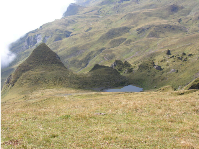
Die Schweizer Alpen sind touristisch stark erschlossen, jedoch ist die Erschliessung ungleich verteilt. Ein Drittel der Landschaft in höheren Lagen ist wenig erschlossen.

Der Landschaftsschützer Hans Weiss (1940-2024) schrieb in der Nationalzeitung vom 13. Dezember 1975 (heute Basler Zeitung BaZ) ein frühes Plädoyer für die Erhaltung unberührter Gebirgsregionen am Beispiel der Hochebene der Greina (Graubünden). Die Greina-Hochebene im Übergang von Graubünden ins Tessin wurde zum Symbol für den Umgang mit wenig berührter alpiner Natur. In dieser Zeit war auf der Greina als einer der letzten wilden Hochebenen der Schweiz ein Wasserkraftwerk geplant. Dagegen wehrte sich eine Bürgerinitiative und es wurde im Jahre 1986 die Greina-Stiftung gegründet. Auf Umsetzung des Wasserkraftprojektes wurde Ende der 1980er Jahre verzichtet. Mit der Einführung des „Landschaftsrappens“ im Jahre 1995 wurde eine Ausgleichszahlung eingeführt, welche die Hoheitsgemeinden teilweise für den Wegfall des