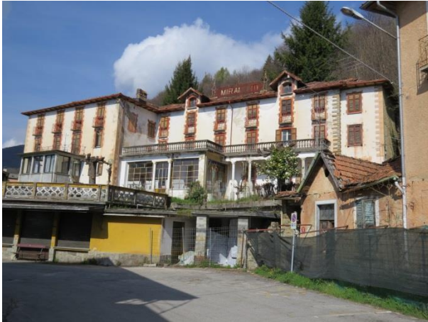
Miramonti - eine Tourismus-Reminiszenz des frühen 20. Jahrhunderts

mehrere Getreidemühlen betrieben haben. Nochmals durch eine kurze Waldpartie stösst man auf die autofahrbare schmale Nebenverbindung, die durch Trarego in Richtung Passo Colle führt und erstaunlicherweise für den Verkehr offen ist. Die Strasse ist allerdings so schmal, dass deren Befahrung abschreckend wirkt. Bald erreicht man den oberen Siedlungsrand von Trarego. Hier fallen die vielen alten Steindächer auf, manches Haus wird nun wieder revitalisiert. Es sind auch einige Dörrhäuschen (Gra) zu sehen. Durch den alten Dorfkern der Via Passo Piazza kommt man am Rathaus und dem angejahrten Albergo La Perla vorbei. Es hat wohl auch schon bessere Tage gehabt.