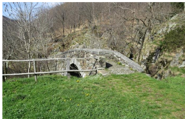
Die so genannte «Römer-Brücke» von Trarego

Die Steigung endet an der sogenannten »Römer«-Doppelbrücke, wo sich in den Tosbecken des Rio Piemese gerne Leute mit einem Bad erfrischen. Der Bach soll früher