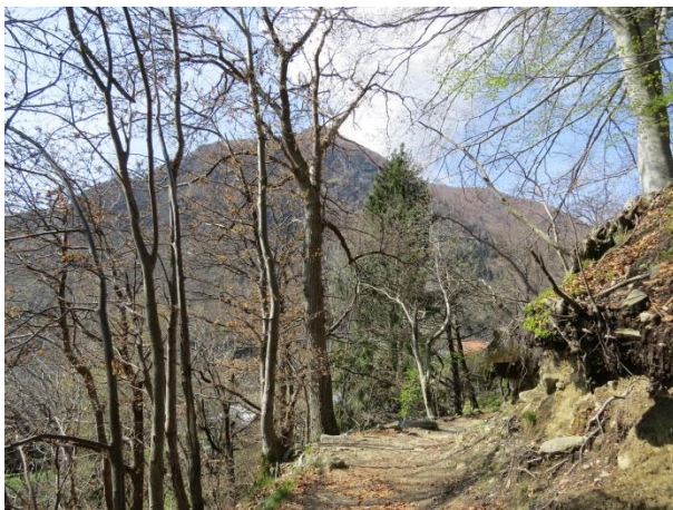
Spazierweg zum Wasserfall, im Hintergrund der Morissolo

Am besten man lässt für den Spaziergang sein Auto nach der Einfahrt nach Trarego beim Friedhof stehen. Dort gibt es links und vor allem rechts der Strasse ausreichend Parkplätze. Entgegen der Empfehlungen in Wanderführern würde ich den Rundgang mit dem Uhrzeiger unternehmen. Vor dem Friedhof steht links eine Kapelle und unter ihr führt eine kurze Fussgängerzone mit Erinnerungen an die gefallenen Soldaten des ersten und zweiten Weltkriegs bergab zu einer Strasse, die man bis zu den Wiesen auf der unter Trarego liegenden Geländeterrasse hinunter geht. Man kommt an einem grossen Haus mit einer angemalten Eule vorbei. Es ist dies das «Civico Museo Tattile di Scienze Naturali, del Lago e della Montagna». Das