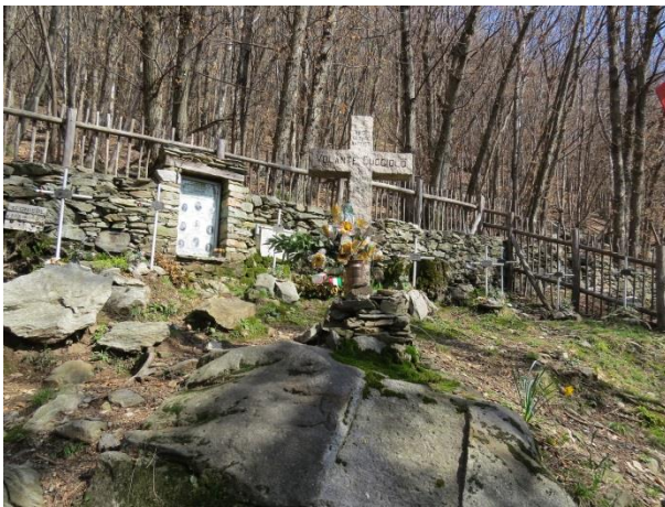
Der kleine Waldfriedhof für die Partisanen

Der teils in den blanken Fels geschlagene Fussweg erreicht dann einen rauschenden, idyllischen Wasserfall, der in einer ausgewaschenen Rinne rund 60 Meter herunterfällt. Das Wasser fliesst unter einem Brückchen weiter talwärts. Dort findet sich ein Steinbänkchen für eine kurze, besinnliche Rast. Im Nahbereich ist in einer quadratischen Felsennische eine kleine Madonna platziert. Auch auf halber Höhe im Wasserfall sieht der scharfe Beobachter links vom tosenden Wasser eine Madonnenstatue, umgeben von Yucca-Lilien. Man fragt sich, wie diese hier im schwierigen Gelände platziert werden konnte.